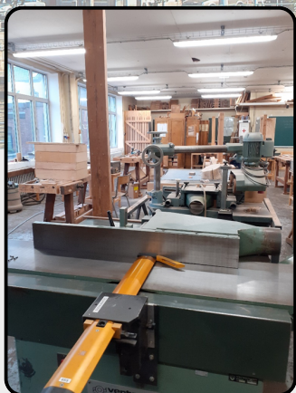
CESLM Site Institut de Travaux Publics

Trois enseignants du lycée P. Bérégovoy ont été accueillis par l'équipe du Centre d'Enseignement Secondaire Léon Mignon à Liège, afin de préparer une mobilité Erasmus+ de 2 semaines pour 6 élèves en mars 2024.