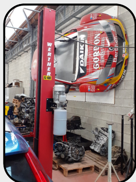
CESLM Site Institut Communal des Techniques de l'Industrie et de l'Automobile